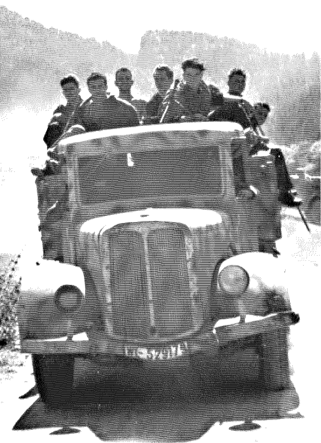
Partigiani: la foto di copertina del libro di Giulio Questi

«Sì, pietà era morta, da quelle parti»: con questa citazione dalla famosa canzone scritta da Nuto Revelli, Questi chiude un racconto che è narrato come un horror e costruito come la potentissima metafora di una guerra senza quartiere. È ufficiale: l'Italia ha un nuovo, grande scrittore, anche se la definizione - quanto quella di «regista» - a Questi non piace: «Detesto le professioni. Chi si definirebbe "scrittore" sulla carta d'identità?».